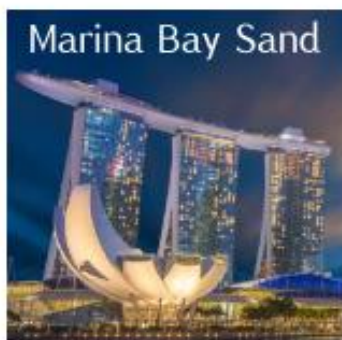
Marina Bay Sand

นำท่านเดินทางสู่ สิงคโปร์ มีชื่ออย่างเป็นทางการว่า สาธารณรัฐสิงคโปร์ เป็นนครรัฐสมัยใหม่และเป็นประเทศที่เป็นเกาะขนาดเล็กที่สุดในเอเชียตะวันออกเฉียงใต้ ประเทศบนเกาะเล็กๆ แต่มากด้วยความเจริญทางเศรษฐกิจ ที่รวบรวมความหลากหลายทางวัฒนธรรมและความทันสมัยได้อย่างลงตัว ถึงแม้สิงคโปร์จะมีพื้นที่ใช้สอยค่อนข้างจำกัด แต่ที่นี่กลับมีแหล่งท่องเที่ยวสวยๆ มากมายไว้คอยให้ผู้คนจากทุกสารทิศได้ไปเที่ยวและพักผ่อนกัน และด้วยความสวยงามอลังการของสถานที่ท่องเที่ยว