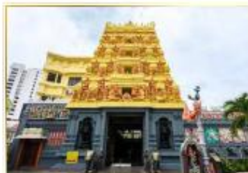
• Sri Senpaga Vinayagar Temple