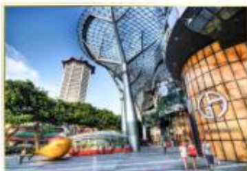
• Orchard Road