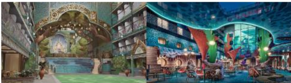
DISNEY IMAGINATION GARDEN

ก้าวออกไปยัง ระเบียงส่วนตัวของคุณ เพื่อดื่มด่ำกับทิวทัศน์อันงดงามตระการตา ไม่ว่าจะเป็น วิวทิวทัศน์, DISNEY IMAGINATION GARDEN หรือ DISNEY DISCOVERY REEF ที่คุณสามารถ เพลิดเพลินได้อย่างสบายจากภายในห้องพักของคุณ