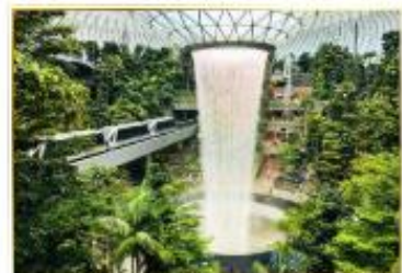
• HSBC Rain Vortex