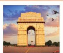
♥♦♦ India Gate