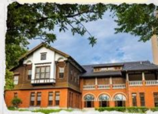
พิพิธภัณฑชาติน้ำพุร้อน