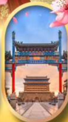
ถนนคนเดินเจียมเหมิน