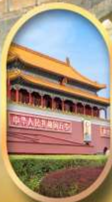
จัสมุรีสเทียนอันเหมิน