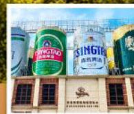
พิลส์กันที่เบียร์ชิงเต่า