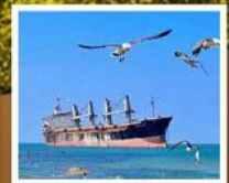
เรือสินค้าเกย์ตันบลูอิส