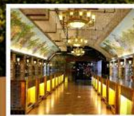
พิลส์กันที่ไวน์ชิงเต่า