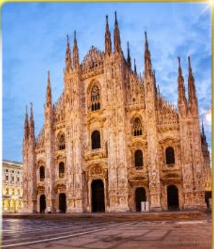
คูโอโมมิลาน