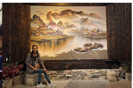
พิพิธภัณฑ์ภาพถ่ายเขียนหินทราย

วันที่สี่ เมืองจางเจียเจีย- ศูนย์ผลิตภัณฑ์หยก –ร้านใบชา – พิพิธภัณฑ์ภาพถ่ายเขียนหินทราย-ไกด์นำเสนอโปรแกรมเสริม สะพานกระจกแกรนด์แคนยอน- เมืองหยี่ซาง