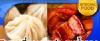
พิเศษ! เสี่ยวหลงเปา หมูน้ำแดง เติมน้ำดื่ม มี.ค. - มิ.ย. 69