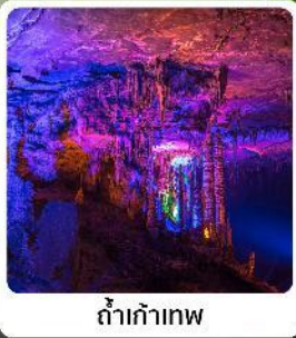
ดำเก้าทพ