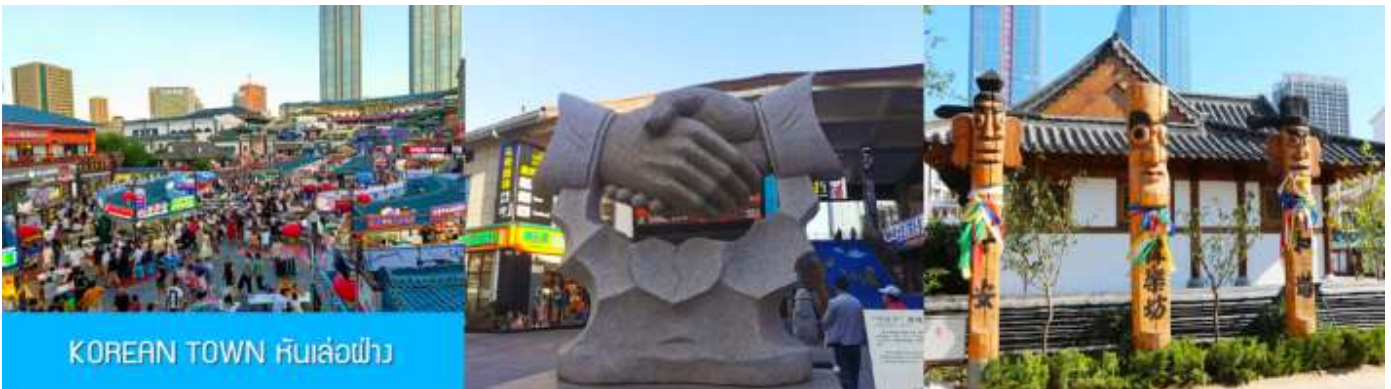
KOREAN TOWN หันเล่อฝาง