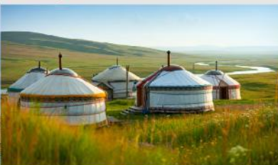
ที่พักแบบกระโจม