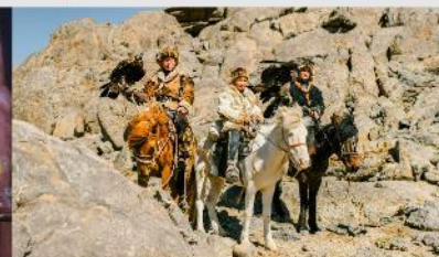
ชนเผ่ามองโกล

*ทางบริษัทฯ ขอสงวนสิทธิ์ในการสลับโปรแกรมทัวร์ตามความเหมาะสมขึ้นอยู่กับสถานการณ์หน้างาน โดยคำนึงถึงผลประโยชน์ของลูกค้าเป็นสำคัญ