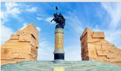
เขตท่องเที่ยวเจงกีสข่าน