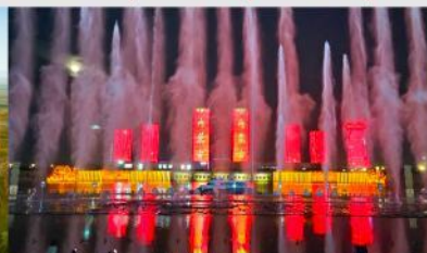
น้ำพุคังปาสื่อ