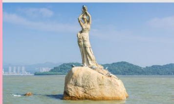
จู่ไห่พีชเชอร์เกิร์ล(หวีหนี่)