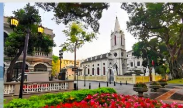
เกาะชาเมี่ยน