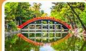
ศาลเจ้าสุมิโยชิ โทคะ