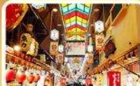
ตลาดปลาชิชิ