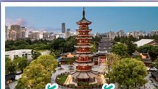
วัดเลงเซ้ง