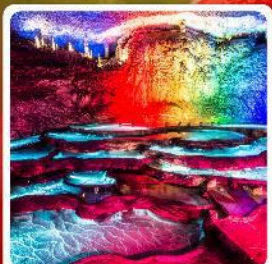
ถ้ำเก้าเทพ

ไฮไลท์! หมู่บ้านชาวนเสี่ยเหรินเจีย หมู่บ้านโบราณฟูหรงเจิ้น ถ้ำเก้าเทพ ล่องเรือทะเลสาบผิงหู สวนถ้ำสามสหาย