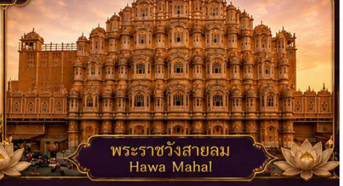
พระราชวังสายลม Hawa Mahal