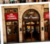
สถานีทูเนล (TUNEL STATION) สถานีรถไฟใต้ดินสายเก่าแก่และเป็นหนึ่งในระบบขนส่งที่เก่าแก่ที่สุดในโลก