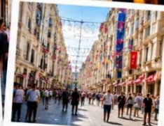
ISTIKLAL STREET (Grand Avenue of Pera) ถนนสายช้อปปิ้ง ยืน 88 ครบรอบในทีเดียว