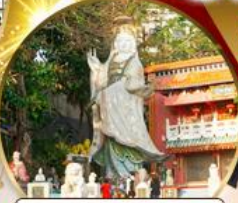
เจ้าแม่กวนอิมริฟลิสเบย์