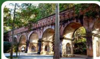
วัดนินเซ็นจิ