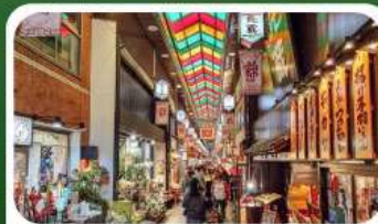
ตลาดปลาชิชิ