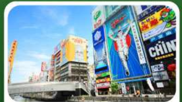
ช้อปปิ้งย่านชินไซบาชิ