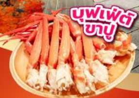
บุฟเฟ่ต์ ซาซู

เช็किनจุดถ่ายรูป ศาลเจ้าฟูจิซัง ฮงกุเซ็นเกินไทยะ