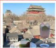
คาเฟ่ น้ำตาล