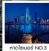
หาดโซเบอร์ NO.3

ของที่ระลึก สุดพิเศษ!! ขวดเบียร์สกรีนรูปของท่าน รัับฟรี!! ท่านละ 1 ขวด