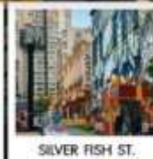
SILVER FISH ST.