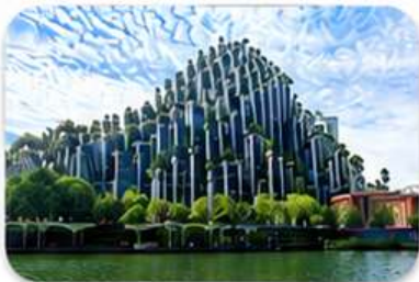
ต้นไม้พันต้น