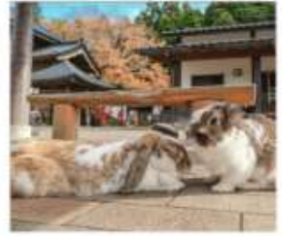
หมู่บ้านกระต่ายดางะ