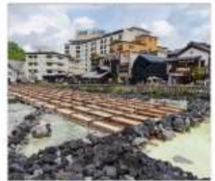
ชมยูมาทาเกะดุกัสทสึ