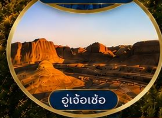
อู่เจ้อเซ่อ