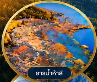
ธารน้ำห้ำสี่