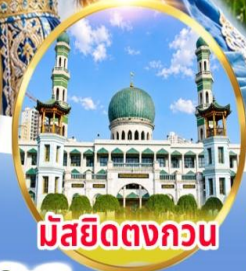
มัสยิดตงกอน