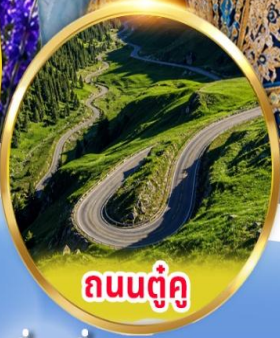
ถนนตุ้กู