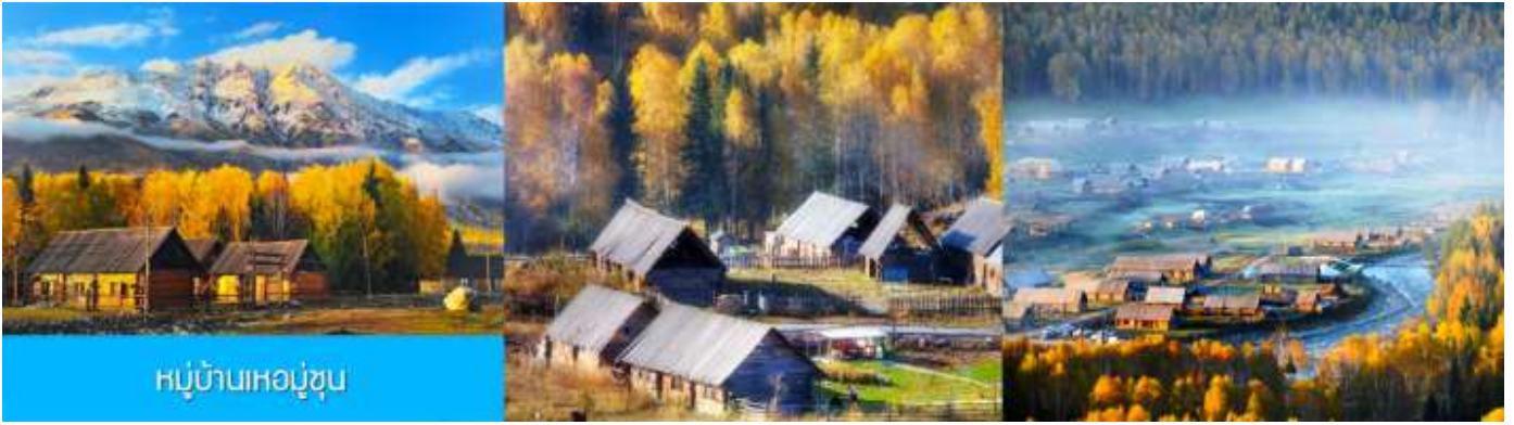
หมู่บ้านหอบู่ซุบ