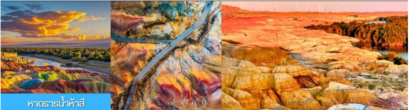
หาดธารน้ำห้าสี