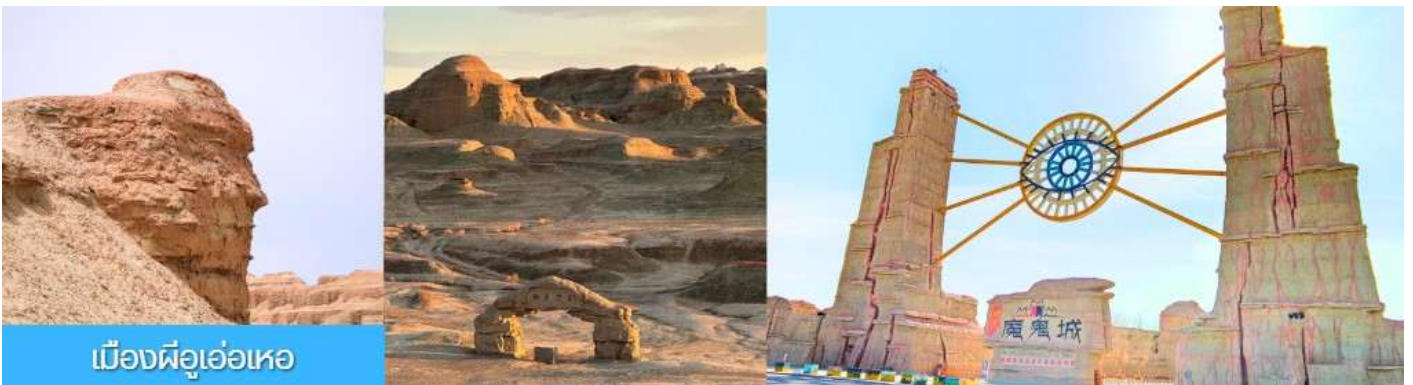
เมืองฝือเอ๋อเหอ

รับประทานอาหารเช้า ณ ห้องอาหารของโรงแรม (13)