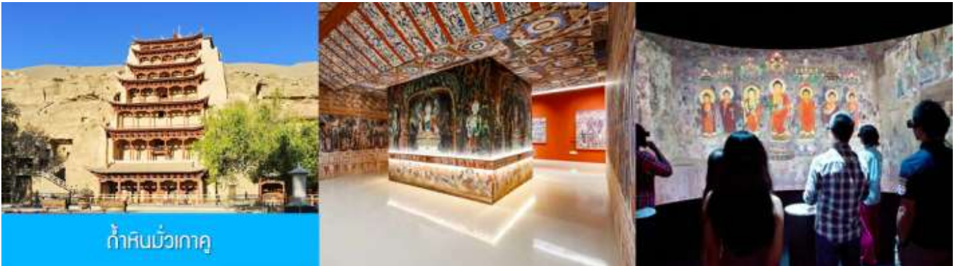
ถ้ำหินมั่วเกา

เช้า รับประทานอาหารเช้า ณ ห้องอาหารของโรงแรม (1)