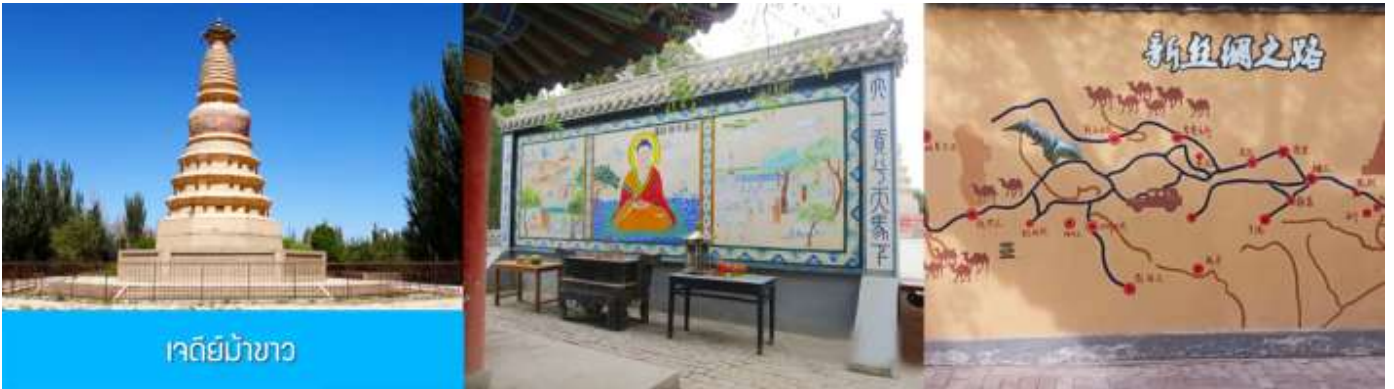
เจดีย์ม้าขาว