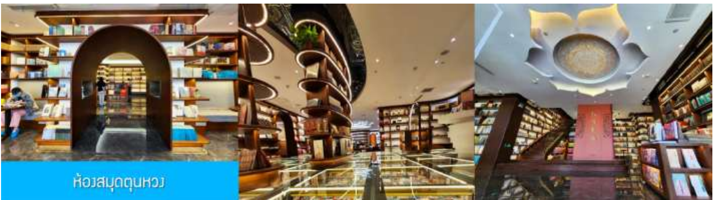
ห้องสมุดตุนหวง