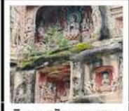
หินแกะสลักหนานคาน

PERIOD 1 : 13 - 17 ต.ค. 2569 PERIOD 2 : 17 - 21 ต.ค. 2569