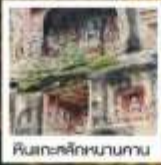
ศิลปะสถาปัตยกรรม