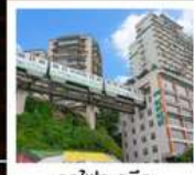
รถไฟกะลุดึก

ภูเขาถ้ำหวู่ซาน (รวมกระเช้า) • อุทยานหมีซางซาน หินแกะสลักหนานคาน • ชมรถไฟกะลุดึก หงหยาดัง • ถนนคนเดินเจี๋ยฟางเป่ย์