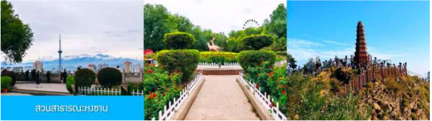
สวนสาธารณะหงซาน

โบราณนี้สร้างขึ้นในช่วงศตวรรษที่สองก่อนคริสตกาลโดยการขุดเจาะลงไปใต้พื้นดิน ภายในมีสิ่งปลูกสร้างโบราณที่มีคุณค่าทางประวัติศาสตร์ อาทิ กำแพง ป้อมปราการ ศาลาวัด และป่าเจดีย์ ฯลฯ จากนั้นนำท่านเดินทางโดยรถบัสสู่เมือง เมืองอูรูมูฉี 乌鲁木齐 (ระยะทาง 180 กม. ใช้เวลาเดินทางราว 2 ชั่วโมงครึ่ง)