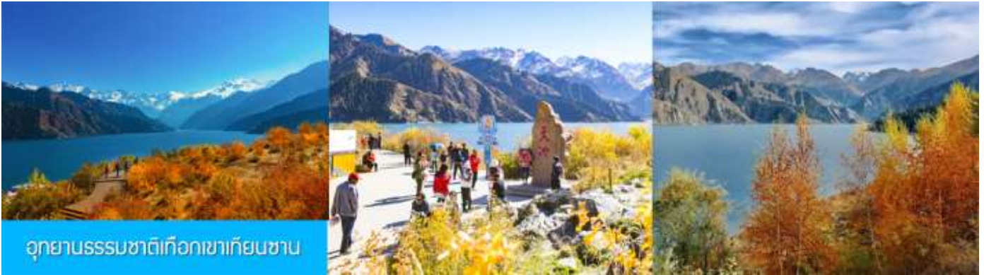
อุทยานธรรมชาติเทือกเขาเทียนชาน

เช้า รับประทานอาหารเช้า ณ ห้องอาหารของโรงแรม (7)