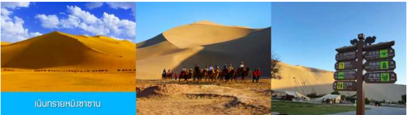
เป็นทรายหมีงาซาซาน

08.20 น. นำท่านเดินทางโดยรถไฟความเร็วสูงขบวนที่ D2708 ตู้เมืองตู้หู้ฟาน (08.20/12.34) 12.34 น. ขบวนรถไฟนำท่านเดินทางถึงสถานีรถไฟหลิวหยวน นำท่านเดินทางสู่ตัวเมือง둔หวาง เพียง รับประทานอาหารกลางวัน ณ ภัตตาคาร (11)