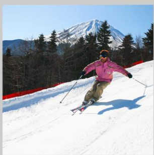
“FUJITEN SNOW PARK”