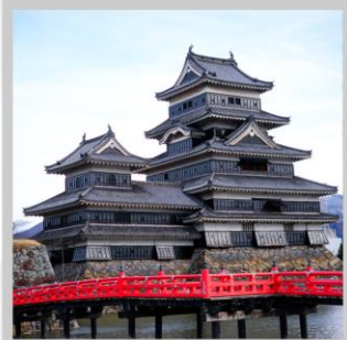
“MATSUMOTO CASTLE PARK”

สัมผัสความงดงามด้านนอก “ปราสาทมัตสึโมโตะ” ที่ตั้งตระหง่านท่ามกลางฉากหลังของเทือกเขาแอลป์ตอนเหนือ เปลี่ยนอิริยาบถ “ส่องเรือชมหุบเขาอะนะเคียว” ชมความงดงามธรรมชาติ ต้นไม้ หน้าผา และสะพานแดงอันโด่งดัง ตื่นตากับการประดับไฟกว่า 5 แสนดวง กับงาน “YAMANAKAKO ILLUMINATION FANTASEUM” ริมทะเลสาบยามานากะ สนุกสนานกับการเล่นหิมะ ในกิจกรรมต่างๆ ณ “FUJITEN SNOW PARK” พร้อมวิวภูเขาไฟฟูจิเป็นฉากหลัง ตระการตา “เทศกาลประดับไฟฤดูหนาว” ในธีมต่างๆหลากหลายโซน จัดแสดงไฟกว่า 2 ล้านดวงที่ยิ่งใหญ่ติดอันดับ1 ของญี่ปุ่น เปลี่ยนอิริยาบถ “นั่งกระเช้าฮาคุบะ อิวะตะกะะ” เพื่อชมวิวเทือกเขาแอลป์ญี่ปุ่นกับทิวทัศน์ฤดูหนาวแบบพาโนรามา