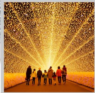
“NABANA NO SATO”