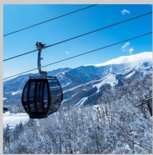
“HAKUBA IWATAKE GONDOLA”