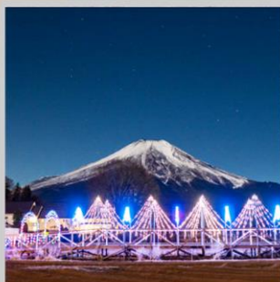
“YAMANAKAKO ILLUMINATION FANTASEUM”