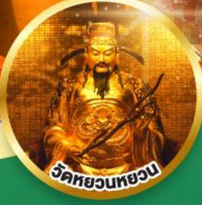
วัดหยวนหยวน ขอพรเรื่องสุขภาพ, โชคลาภ ความเจริญก้าวหน้า

เมนูพิเศษ! ต้มช้ำฮ่องกง, บุฟเฟต์ชาบูสไตล์ฮ่องกง, ห่านย่าง